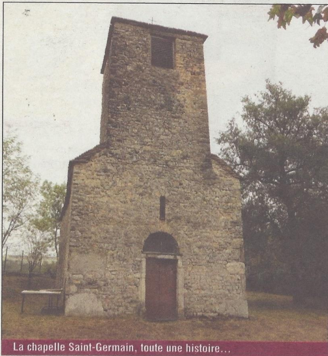
La chapelle Saint-Germain, toute une histoire...